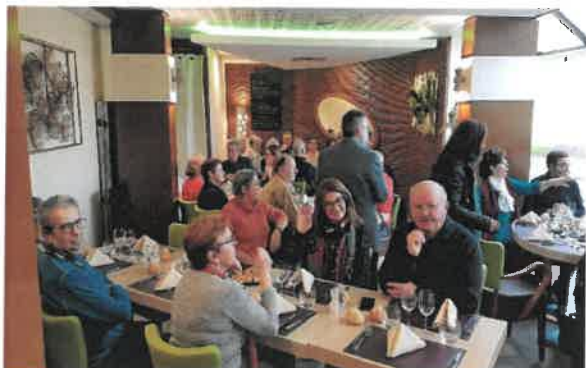
anniversaire du Doyen du Club