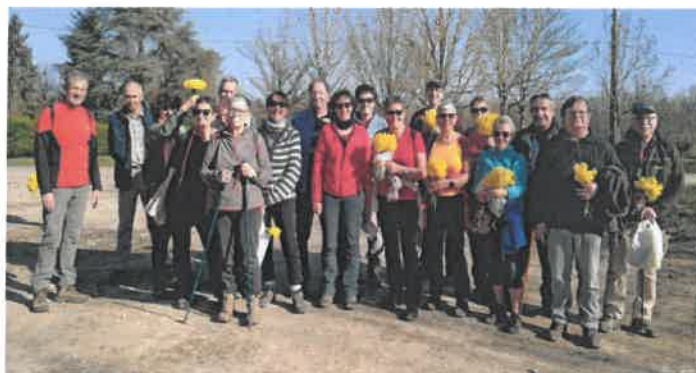
randonnée des jonquilles