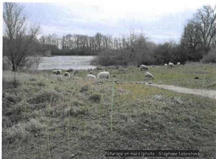
Pâturage en mars

Le troupeau que vous pouvez rencontrer sur le site du Bec d'Allier est un troupeau itinérant, qui se déplace sur plusieurs secteurs du site, mais également sur plusieurs sites au cours de la saison. De ce fait, la présence du troupeau et des clôtures n'est pas permanente. Lorsque le troupeau de moutons est présent, les comportements doivent être appropriés : n'effrayez pas les moutons, restez calmes, ne criez pas et ne franchissez pas les clôtures. De plus, la garde du troupeau est parfois effectuée par des chiens patous. Ils ont pour mission de le protéger contre les chiens errants, tous les prédateurs sauvages potentiels, mais aussi contre les sangliers qui abîment parfois les clôtures. Tenez vos chiens en laisse et éloignés du troupeau. Si les patous aboient, c'est que vous êtes trop près de troupeau, alors reculez. Lorsque le troupeau est présent, des panneaux sont posés pour vous prévenir et vous rappeler ces comportements adaptés.