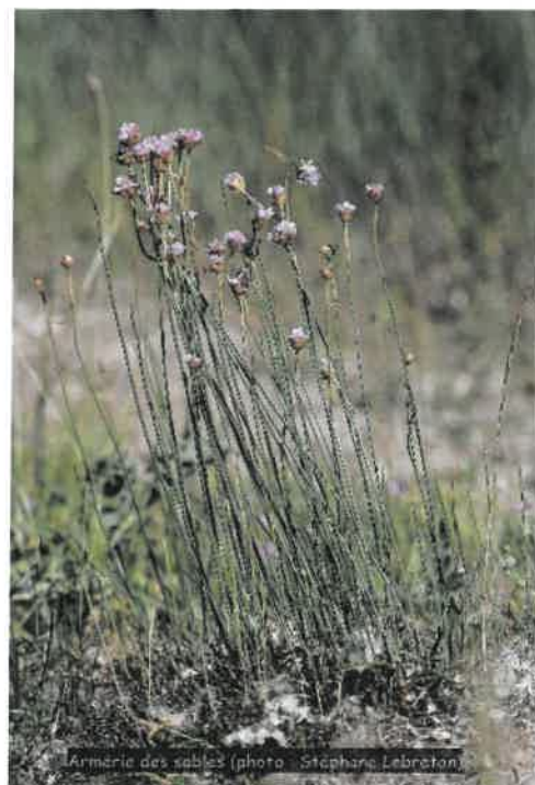
Armoïse des sables