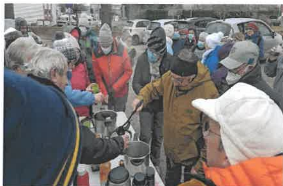
randonnée du vin chaud