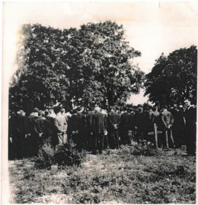
la foule au cimetière pendant l'inhumation du caporal WILKINSON du 1 er FFI S.A.S