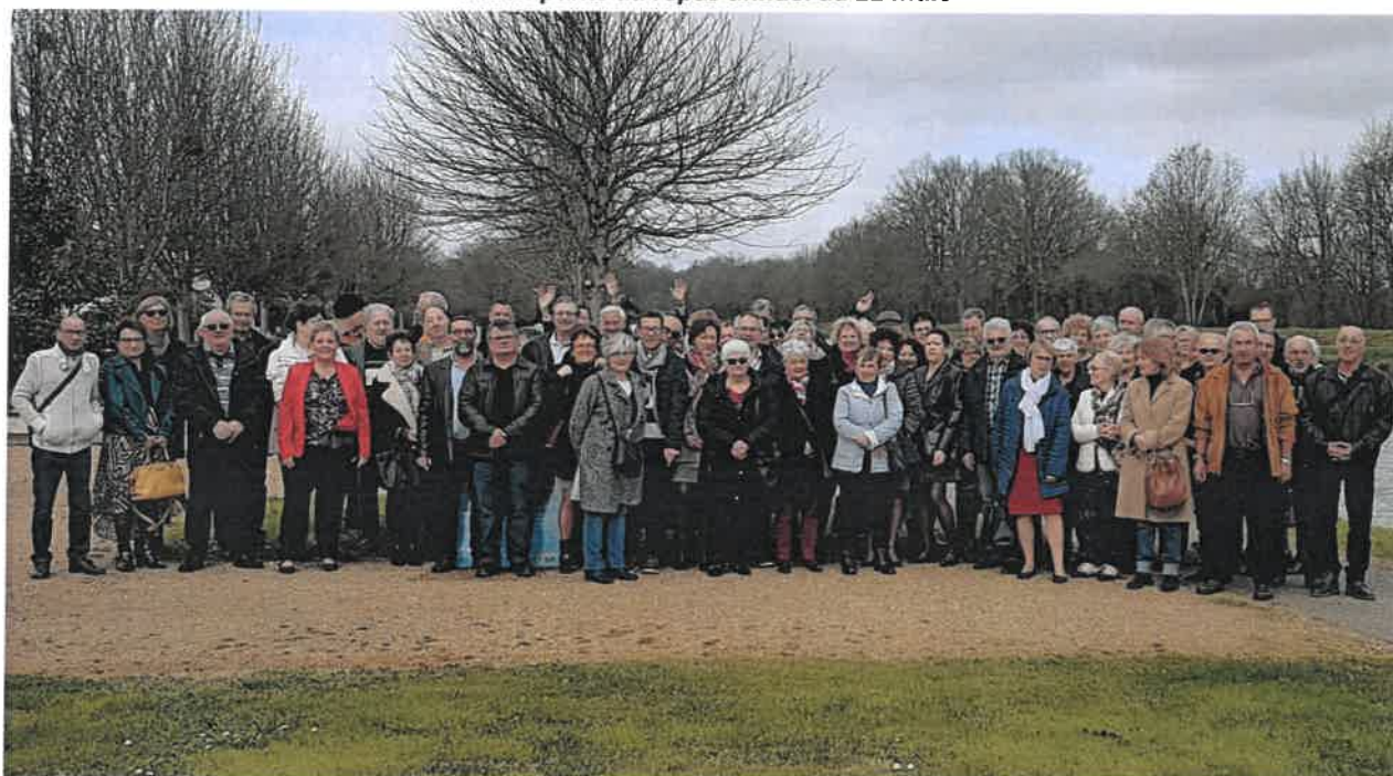
Participants au repas annuel du 12 mars

Les programmes des randonnées 2023 sont accessibles sur le site internet de l'association à l'adresse indiquée ci-après, dans la rubrique "agenda".