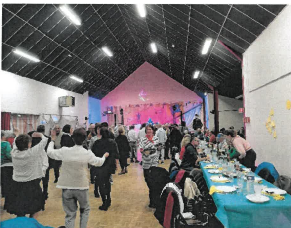
Sur la piste