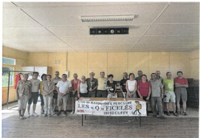
la Grande Vadrouille