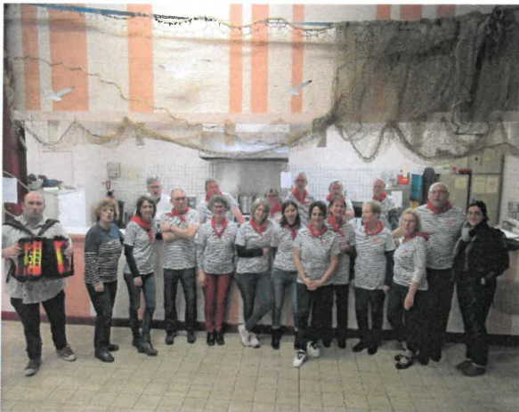
Une partie de l'équipe avec le musicien