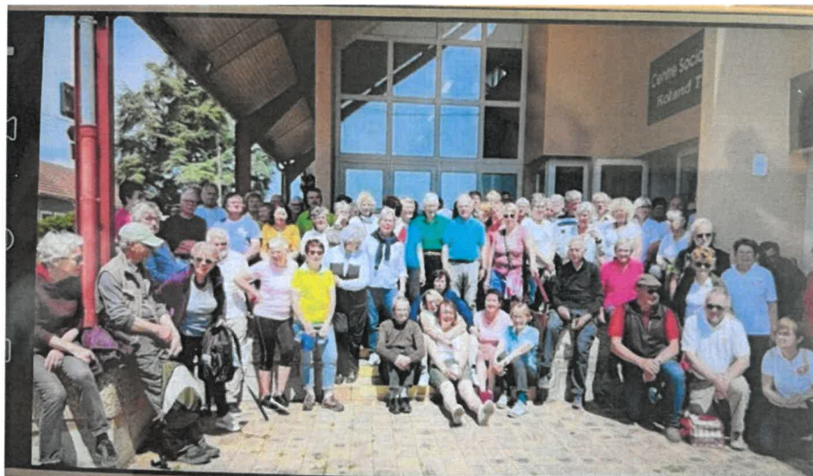
journée départementale de randonnée